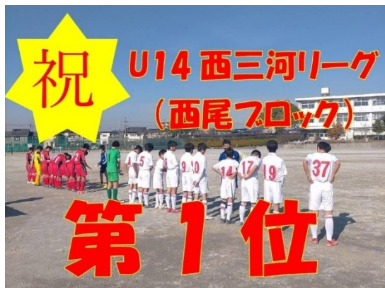
2021 年度 U14 西三河リーグ (西尾ブロック) 第1位