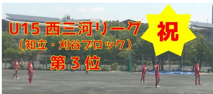
2022 年度 U15 西三河リーグ (知立・刈谷ブロック) 第3位