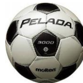
サッカーボール (ペレーダ3000) 3200円⇒3100円 _____ 個