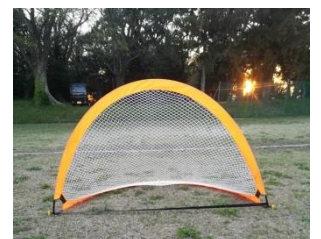
ミニゴール 6800円⇒6120円 _____ セット